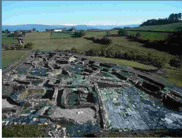
Vista general del poblado.