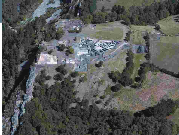
Vista aérea del yacimiento.