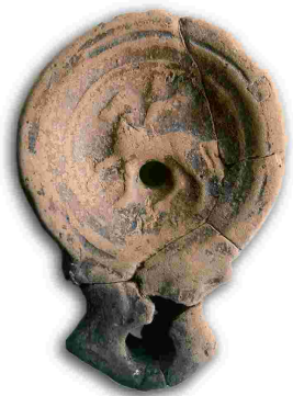
Lamparilla de aceite romana con representación de Pegaso. Siglo I d.C.

The Museum tries to illustrate the origin and evolution of the fortified settlements west of Asturias from the findings of the several archaeological research projects. These projects were carried out for decades as a part of the activities program of the Archaeological Plan of the Navia-Eo basin, which builds houses.