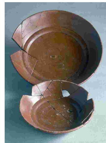
Cerámica común romana de cocina. Siglo II d.C.

Service of Terra Sigillata Hispanic originates in the Tritium Magalum's potter's workshop. 2nd century A.D.