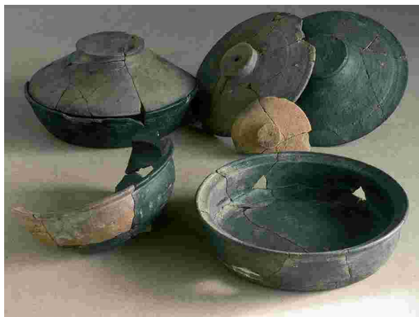
Vajilla de Terra Sigillata Hispánica procedente de los alfares riojanos de Tritium Magalum. Siglo II d.C.

The Archaeological collection has a full and relevant set of pieces originating from the Chao Samartín. However, there are also several pieces from other region sites, including "Os Castros", Taramundi or "Monte Castrelo", Pelou.