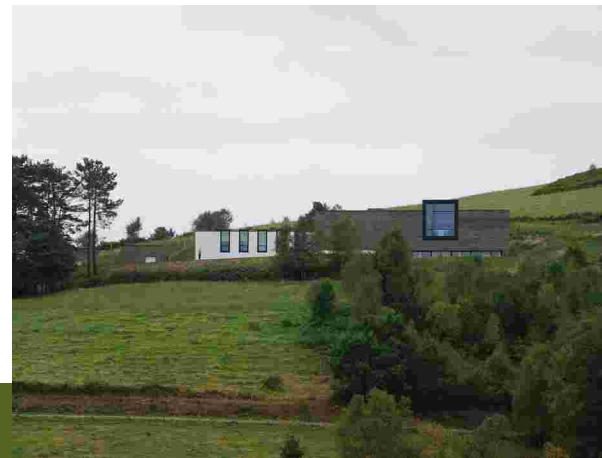
Vista general del edificio.

Roman oil's lamp with representation of Pegasus. 1st century A.D.