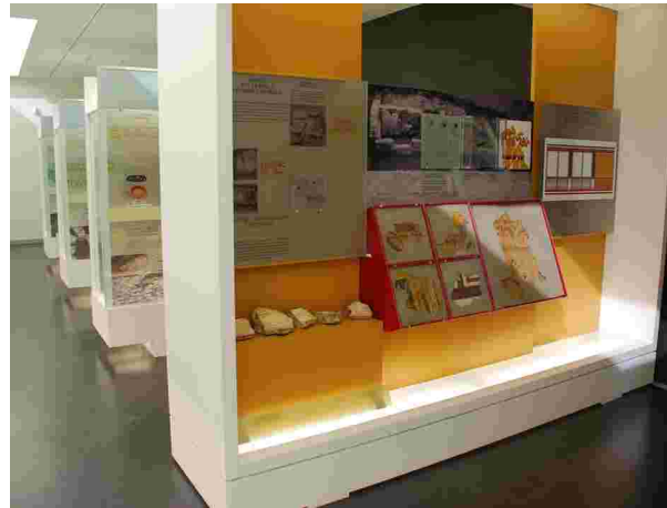
Detalle de la exposición permanente.

The permanent exhibition is articulated in four thematic blocks: the archaeological precedents of the region, the Chao Samartín and its current context, the significant chronological chapters represented in the site and the reconstruction of its history from the archaeological materials.