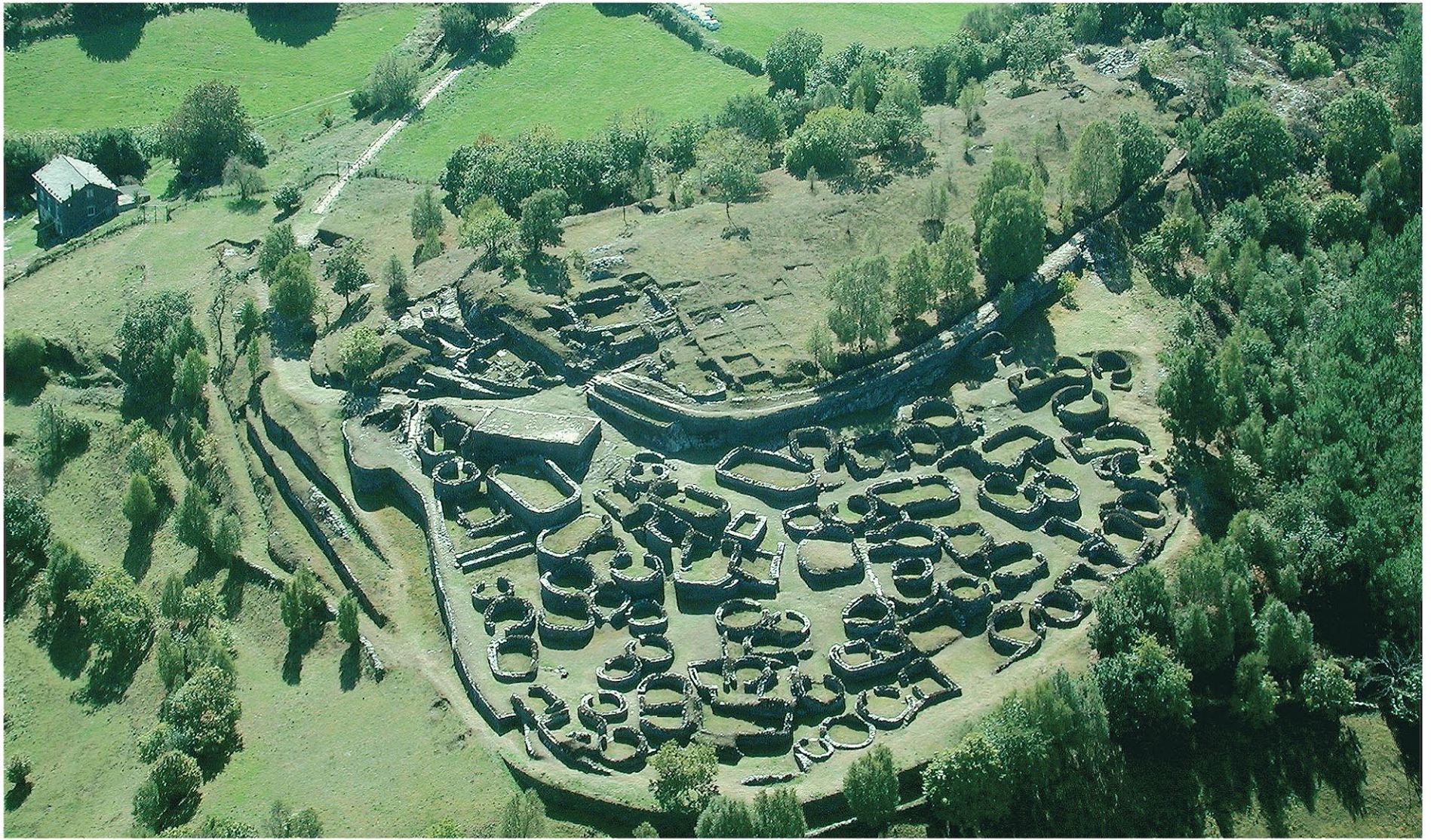
Castro de Coaña.