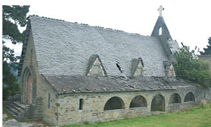
Vista de la iglesia en la actualidad.

Salto del Navia C.B. vendió por 1.500 euros la iglesia, un edificio anexo y la finca de 3.414 m 2 PÁG. 16 A 22