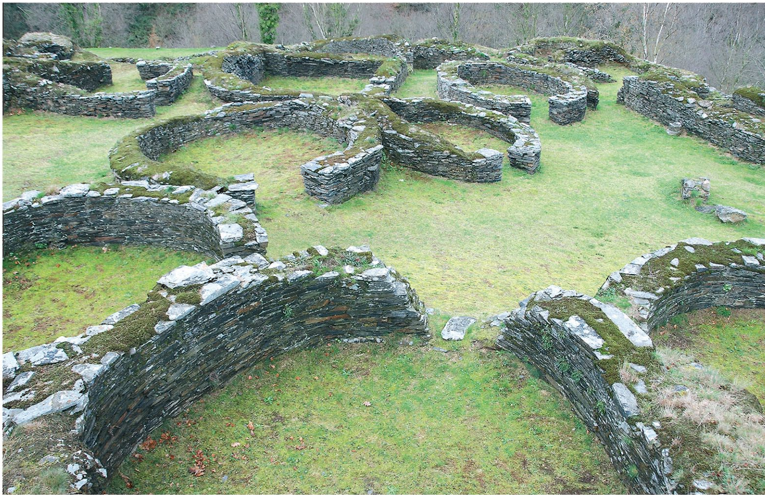
Restos de edificaciones del castro.

gación serias. Coaña es en muchos aspectos el mejor ejemplo de la evolución de nuestra Arqueología en todos estos ámbitos y, en esto del borrón y cuenta nueva, también.