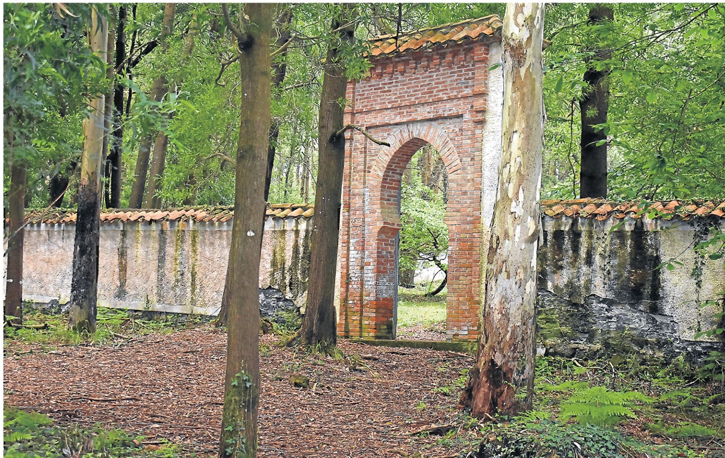
Entrada al recinto funerario a través del arco monumental de herradura apuntado.