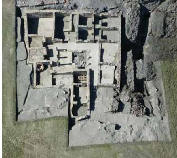
Vista cenital del área excavada

La construcción de la domus y el modo de vida que trajeron consigo sus distinguidos ocupantes incentivó la adopción de nuevas costumbres, usos y ajuares entre aquellas familias locales destinadas a dirigir las civitates establecidas por Roma.