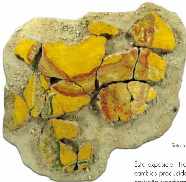
Retrato masculino con liebre

Esta exposición trata de mostrar los cambios producidos en una comunidad castreña transformada, bajo la férrea tutela del ejército romano, en residencia aristocrática y probable capital administrativa de la civitas Ocela mencionada por Ptolomeo.