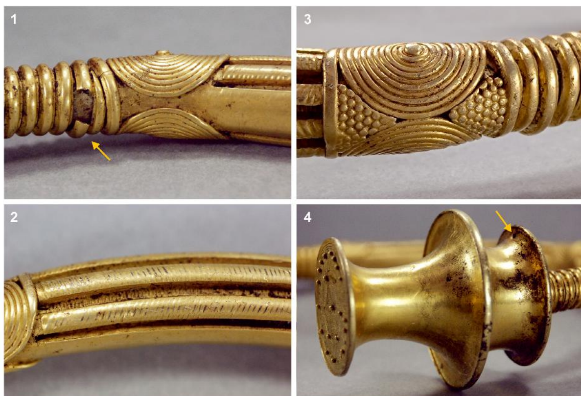
Figura 5. Detalles del torques MAA 094450. 1. Reconposición en los tramos de varillas laterales del aro, apuntamiento de la varilla en el extremo y placas con espirales; 2. Espirales con placas triangulares de falso granulado; 3. Decoración de líneas oblicuas (superior) y motivos en escalera (fondo) en la zona central del aro; 4. Terminal (B), con orificio de evacuación de gases.

varillas están cuidadosamente terminados en punta, para mejor integrarse en la topografía del torques (Fig. 5.1).