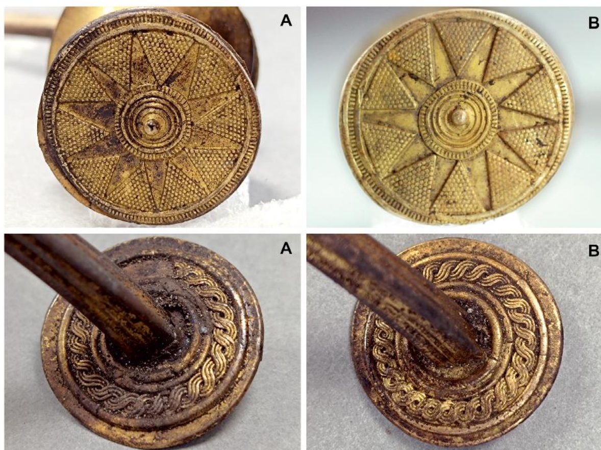
Figura 8. Torques MAA 09449. Decoración de los discos frontales (superior) y posteriores (interior) de los terminales.

El aro, macizo y vaciado a la cera perdida, tiene sección cuadrangular, aumentando ligeramente de grosor en la parte central y, también, hacia los extremos; se dispone romboidalmente con respecto al eje de la pieza. Los lados exteriores presentan estrías longitudinales, alternando tres en la zona central y partes próximas a los extremos, y dos en la superficie más estrecha de los laterales. Los interiores son lisos, mientras que las aristas fueron suavizadas (Fig. 7.1-3).