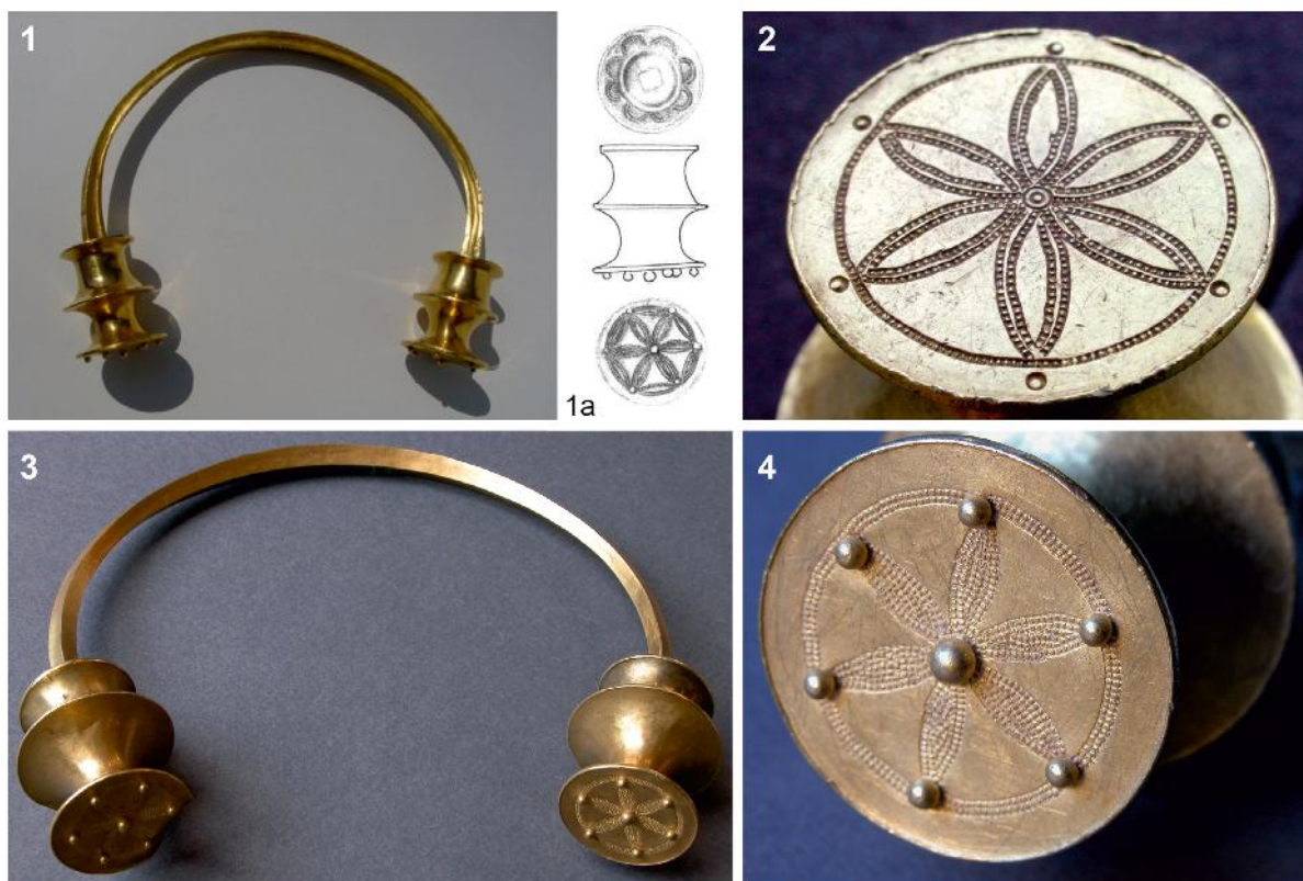
Figura 10. Torques Flavienses: 1. Rendufe (M.Arq.Num. Vila Real, inv. 6901); 1 a. Ornamentación de uno de los terminales de la misma pieza; 2. Torques flaviense de la provincia de Lugo (Museo Prov. Lugo, inv. 2015/588); decoración de uno de los terminales; 3-4. Torques de procedencia incierta (British Museum, inv. 1960,0503.1): 3. Vista de la pieza; 4. Ornamentación de uno de los terminales (Fotografías 1: Museu de Arqueologia e Numismática de Vila Real; 1a: según Silva, 2007; 2: Óscar García-Vuelta; 3-4: Repertorio Au, CCHS-CSIC, Alicia Perea).

varillas enrolladas y terminales huecos en doble escocia, decorados a punzón en los discos exteriores, se identifica en un ejemplar del conjunto de Laviana (MAN. 33.134 a 33.136) (García-Vuelta, 2007, pp. 103-105).