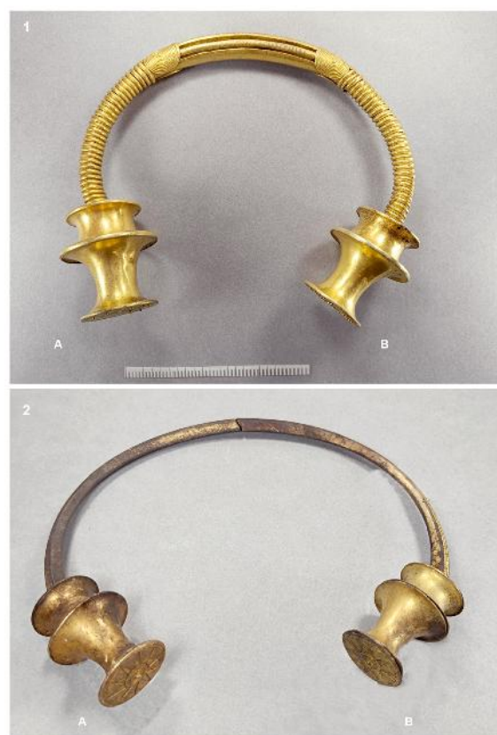
Figura 1. Torques de Cavandi. 1. MAA 09450; 2. MAA 09449 (reconstruido). Las letras A y B corresponden a la identificación de terminales y laterales en el texto.

diciones compartidas que dificultan la caracterización formal y tecnológica de la producción, aspecto esencial para la identificación de posibles talleres, grupos regionales, y su verosímil diacronía.