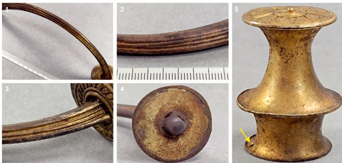
Figura 7. Torques MAA 09449. 1-3. Superficie estriada del aro; 4. Disco posterior del terminal A, apreciándose la penetración del extremo del aro, sin restos de dorado; 5. Cuerpo del mismo terminal, con orificio de evacuación de gases.

Está formado por un aro en forma de C, y dos terminales huecos con perfil en doble escocia. La estructura se compone de varias piezas fabricadas individualmente soldadas posteriormente entre sí.