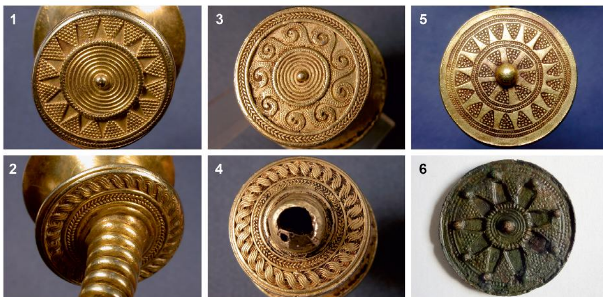
Figura 11. 1 a 5. Ornamentación de los terminales en diferentes torques de Asturias. 1-2, Langreo (IVDJ); 3-4, Villamayor (MAN); 5, Laviana (MAN, inv. 33.132). 6. Elemento discoidal de base Cu con decoración a la cera perdida (MAA, inv. 06645), procedente de Castiellu de Llagú.