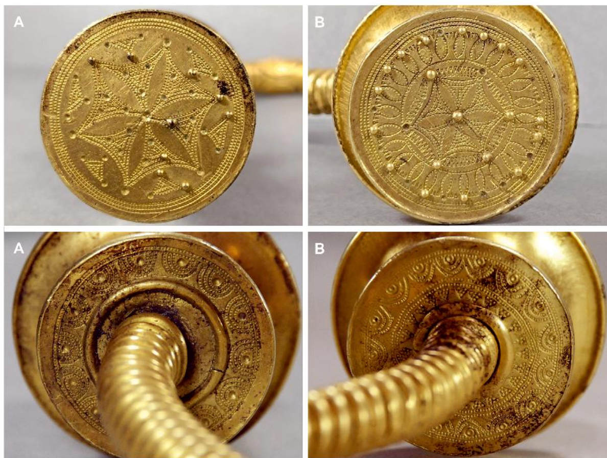
Figura 6. Torques MAA 094450. Decoración de los discos frontales (superior) y posteriores (inferior) de los terminales.

por un toque de punzón como el empleado para realizar las camas de los gránulos (Fig 6, Inf. A). Por su parte el disco trasero B ofrece la misma cenefa en semicírculos, pero centrados con punzón de media perla, a la que se añade una segunda cenefa realizada con punzón triangular relleno de seis puntos (Fig 6, Inf. B). Tanto el A como el B presentan una moldura plano-convexa en torno al hueco a través del que se introduce el aro en los terminales. El terminal B incorpora en su interior un posible elemento de sonajero, rasgo documentado en otros torques castreños con terminales huecos (Armbruster y Perea, 2000, p. 102), que será objeto de un estudio arqueométrico más detallado.