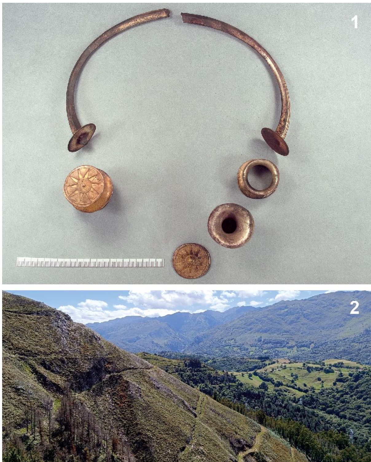
Figura 3. 1. Estado en el que se recuperó el torques 09449; 2. Paraje en el que se produjo el hallazgo.