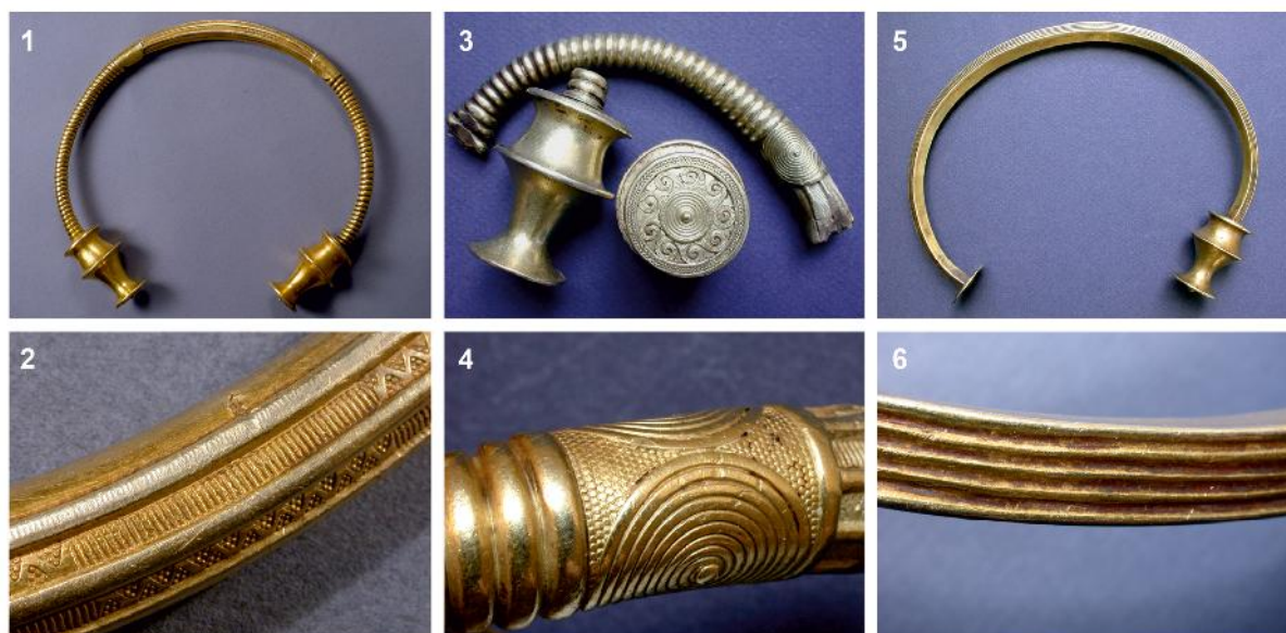
Figura 9. Diferentes torques de Asturias. 1-2, Langreo (IVDJ, inv. 7023): 1. Vista de la pieza; 2. Decoración moldurada en la zona central del aro; 3-4, Villamayor, Piloña (MAN, inv. 33.133, 33.137 y 33.138): 3. fragmentos conservados; 4. Detalle de la placa a la cera perdida con parejas de espirales y fondo de falso granulado; 5-6, Laviana (MAN, inv. 33.132): 5. Vista de la pieza; 6. Decoración estriada en una de las caras exteriores del aro (fotografías 1-2: Repertorio AU, CCHS-CSIC. Óscar García-Vuelta y Alicia Perea; fotografías 4-6: Óscar García-Vuelta).

guió además mediante la soldadura de placas independientes (Fig. 5.3).